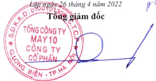
Thân Đức Việt