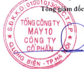
Thân Đức Việt